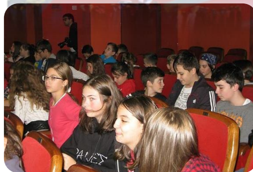
Sala Thalia - filmul documentar Familia mea complicată și fericită