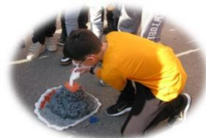
Învățăm cum reacționează diverse substanțe puse în contact